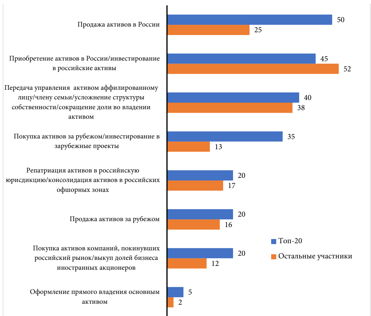
Рис. 2. Адаптационные стратегии российских миллиардеров в 2022–2025 гг., % представителей группы

В ходе эмпирического анализа способов адаптации российских миллиардеров к новым институциональным условиям была выявлена значительная диверсификация поведенческих стратегий и разнонаправленность осуществляемых действий в зависимости от объема капитала. Представители топ-20 рейтинга предпринимали более активные действия, пытаясь диверсифицировать риски и сохранить капитал (см. рис. 2), что, вероятно, иллюстрирует большой авантюризм в отношении зарубежных инвестиций (введение рестрикций было направлено на изоляцию российских миллиардеров и консервацию сопряженных с ними бизнес-структур, однако на практике наблюдается диаметрально противоположная реакция). Также лидеры рейтинга Forbes оказались более заинтересованы в приобретении активов компаний, покинувших российский рынок, в то время как остальные миллиардеры выступили гарантом внутристрановой стабильности, инвестируя в отечественные активы.