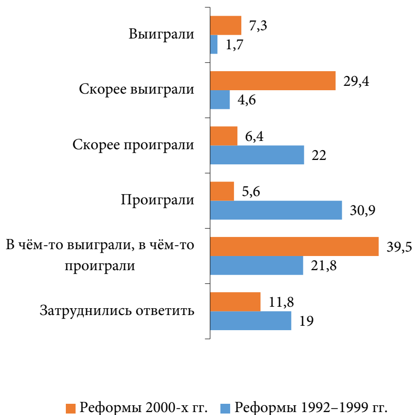
Рис. 1. Оценки влияния результатов реформ 1990-х и 2000-х гг. на жизнь респондентов и их семей, %

Даже маститые политологи и другие опытные специалисты склоняются к тому, что прогнозировать развитие политической ситуации в России практически невозможно.