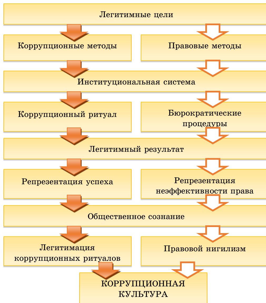
Рис. 2. Процесс формирования коррупционной культуры механизмами ритуализации и легитимации коррупционных практик в условиях низкой эффективности правореализации (цветом выделены стрелки, обозначающие высокоэффективные связи, без заливки цветом – низкоэффективные)

Описанная выше модель отношений иллюстрирует феномен альтернативности коррупции в отношении официального права. То есть идентифицируются два института регулирования формальных отношений, функционирующие параллельно, где каждый сопровождает процесс реализации формальных социальных практик посредством собственных методов – правовых, либо криминальных (коррупционных). Также необходимо отметить, что оба института находятся в общем аттракторе целеполагания – достижение легитимного результата. При этом у коррупции богатая традиция и отработанные временем модели, а у права – низкоэффективный правореализационный механизм и дихотомичные модели регулирования, обусловленные отсутствием устойчивой традиции правового регулирования и частой трансформацией нормативно-правового пространства, его противоречивостью и декларативностью.