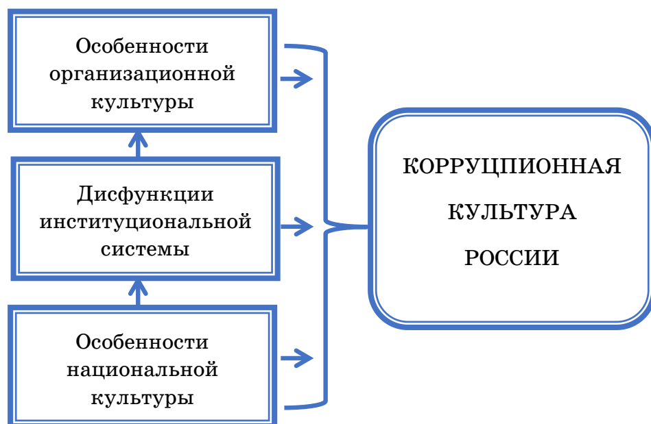
Рис. 1. Модель детерминаций особенностей коррупционной культуры России

В данном случае сложно установить прямые детерминационные связи между указанными явлениями, так как это требует проведения достоверного исторического анализа развития коррупции в России. В ранжировании хронологии детерминации социальных феноменов мы ориентировались на общепринятое в социологической науке понимание социальных процессов и механизмов. Тем не менее, очевидно, что все три причинных комплекса могут быть в равной степени идентифицированы в российской правовой культуре. В данном случае определённые ранги в механизмах причинности присвоены им на тех основаниях, что особенности национальной культуры определяются территориальными, географическими, природно-климатическими, геополитическими и иными причинами, носящими объективный, несоциальный характер, в то время как другие причинные блоки зачастую определяются собственно социальными основаниями. При этом, вне зависимости от детерминационного статуса в отношении друг друга, все три блока причин определяют особенности коррупционной культуры в России в равной степени.