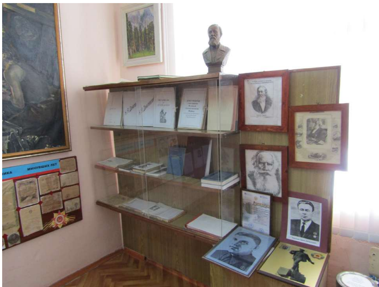
Рис. 8. Фрагмент экспозиции школьного музея в с. Преображение Измалковского м.о. Липецкой обл. Октябрь 2022 г.

Figure 8. Fragment of the exposition of the school museum in the village of Preobrazhenye, Izmailkovsky District, Lipetsk Region. October 2022.