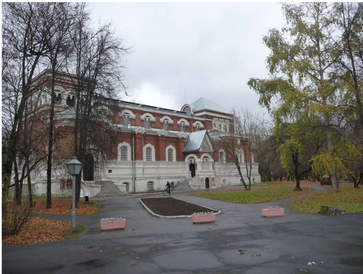
Рис. 2. Улица и городской сквер в г. Гусь-Хрустальный Владимирской обл. Октябрь 2016 г.

Figure 2. Street and city square in Gus-Khrustalny, Vladimir region. October 2016.