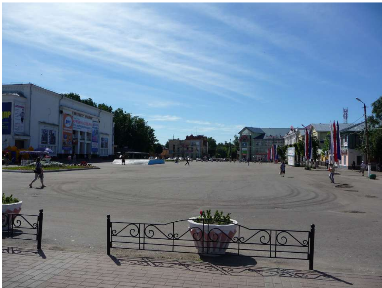
Рис. 1. Площадь в г. Шуя Ивановской обл. Июнь 2013 г.

Еще в 2013 г., в начале деятельности по изучению регионов, автор посетил г. Шуя Ивановской обл., а в 2016 г. – Гусь-Хрустальный Владимирской обл. Ивановская область на основании анализа социально-экономических показателей считалась регионом бедным, депрессивным, малоперспективным. Владимирская область в силу своего географического положения (через регион проходят автомобильная и ж/д магистрали, соединяющие Москву с Нижним Новгородом и восточными регионами, а также стратегически важный водный путь по р. Оке Москва – Коломна – Рязань – Муром – Н. Новгород) была в лучшем состоянии, но также никогда не причислялась к богатым и процветающим регионам. Причем местом проведения исследований были выбраны не областные столицы, а города небольшие, даже в своих регионах находящиеся не в лидерах по экономическим показателям.