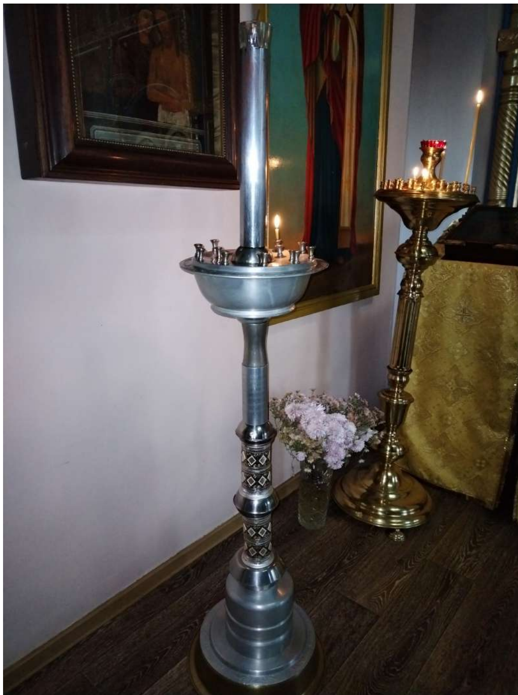
Рис. 10. Самодельный поставец. Ок. 1975. г. Комсомольск-на-Амуре, Хабаровский кр. Октябрь 2025 г.

Figure 10. Homemade church candlestick. Circa 1975. Komsomolsk-on-Amur, Khabarovsk Krai. October 2025.