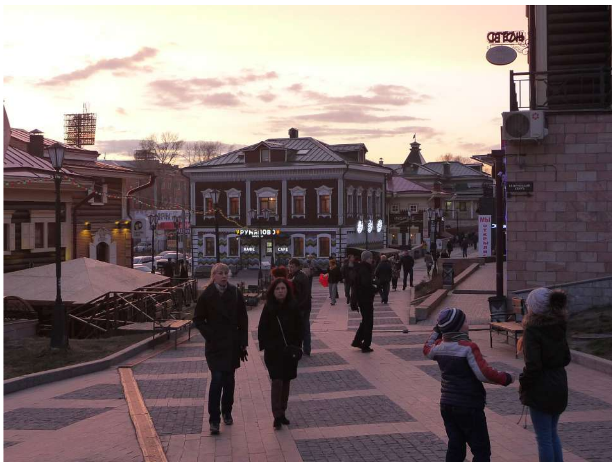
Рис. 3. Ул. Седова в Иркутске. Апрель 2019 г.

Figure 3. Sedov Street in Irkutsk. April 2019.