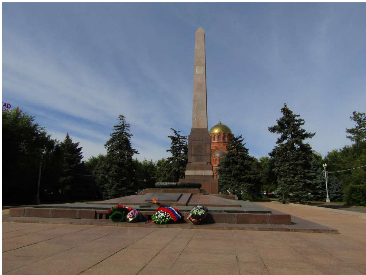
Рис. 5. Мемориал Гражданской и Великой Отечественной войн на пл. Павших Борцов, г. Волгоград. Сентябрь 2020 г.

Характерным примером является памятник в центральной части г. Волгограда (рис. 5). Изначально на этом месте были похоронены казненные белогвардейцами в 1919 г. большевики 1 . Во время Сталинградской битвы памятник оказался в эпицентре боев и серьезно пострадал, однако не был уничтожен полностью. Сразу после освобождения города около этого мемориала стали хоронить погибших советских бойцов, чьи тела лежали в подвалах по всему городу. Позднее мемориал был восстановлен почти что в первоначальном виде, и стал памятником двух войн 2 . При посещении данного монумента было отмечено, что у памятника лежат венки и цветы, судя по виду, возложенные недавно. А ведь снимок сделан много времени спустя после 9 мая и 22 июня – основных памятных дат, да к тому же в период пандемии covid-19, когда массовые акции почти не проводились. Таким образом, можно сделать вывод о сохранении живой традиции памяти, которая не просто существует в сознании, но имеет действенное проявление, как минимум в символических акциях.