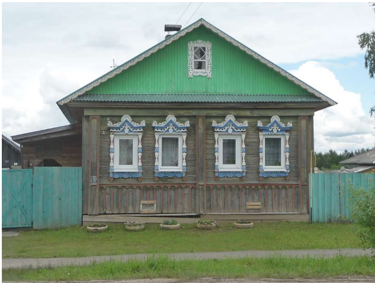
Рис. 4. Частный дом в пос. Сусанино Костромской обл. Июль 2017 г.

Figure 4. Private house in the village of Susanino, Kostroma region. July 2017.