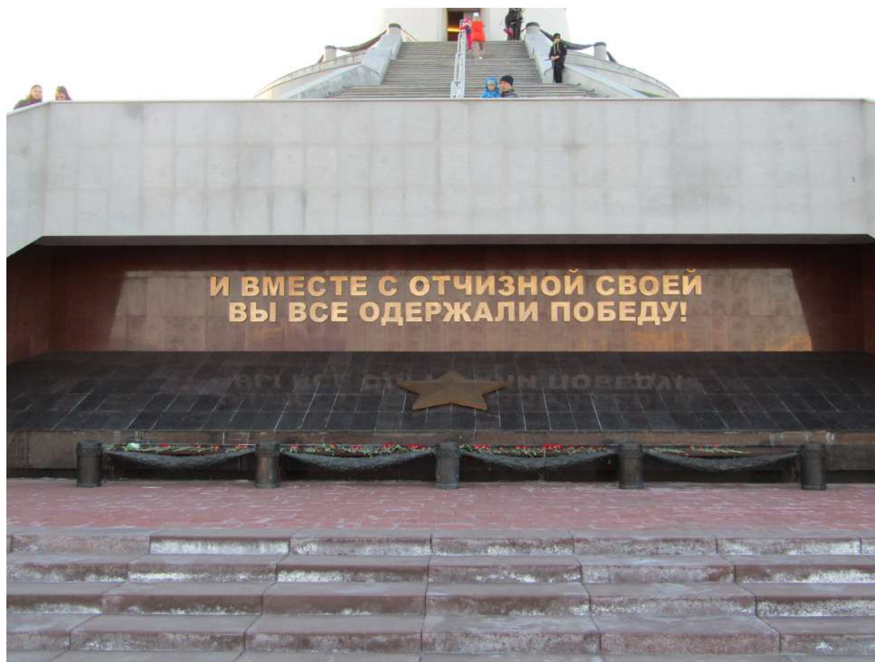
Рис. 6. Подножие мемориала Воину-освободителю, г. Кемерово. Апрель 2023 г. Figure 6. The base of the memorial to the Liberator Soldier, Kemerovo. April 2023.

Также можно привести как пример установленный в г. Кемерово памятник, повторяющий скульптуру Воина-освободителя работы Е. Вучетича в мемориальном комплексе Трептов-парк в Берлине. Установка именно такого памятника связана с тем, что прообразом оригинальной скульптуры послужил уроженец Кемеровской области Николай Масалов, во время уличных боев в Берлине спасший немецкую девочку. Данный памятник находится на окраине города, транспортная доступность там оставляет желать лучшего, тем не менее туда постоянно идут люди, в чем автор имел возможность убедиться лично. К его подножию постоянно приносят цветы, не только в какие-либо памятные даты. Важно отметить, что преимущественно это не венки, корзины, даже не букеты, которые могли бы возлагать организованные группы, делегации и т. п. Это большое количество красных гвоздик, очевидно приносимых по 2–4 шт. многочисленными посетителями (рис. 6). Чем именно вызвано такое отношение сказать сложно, не прибегая к иным методам исследования. Но на этом примере можно видеть, как при помощи данного метода можно определить точки, направления особого исследовательского внимания в конкретных регионе, локальности.